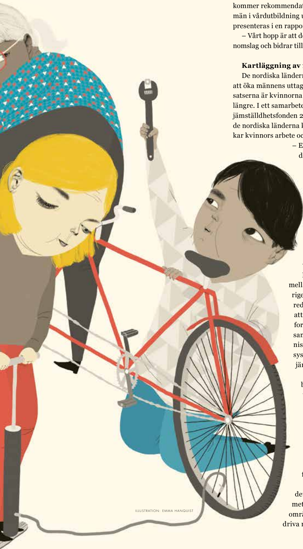
ILLUSTRATION: EMMA HANQUIST

Inom projektet ska även den befintliga forskningen på området att sammanställas. Baserat på resultaten kommer rekommendationer för att rekrytera och behålla män i vårdutbildning utvecklas. Resultatet kommer att presenteras i en rapport.