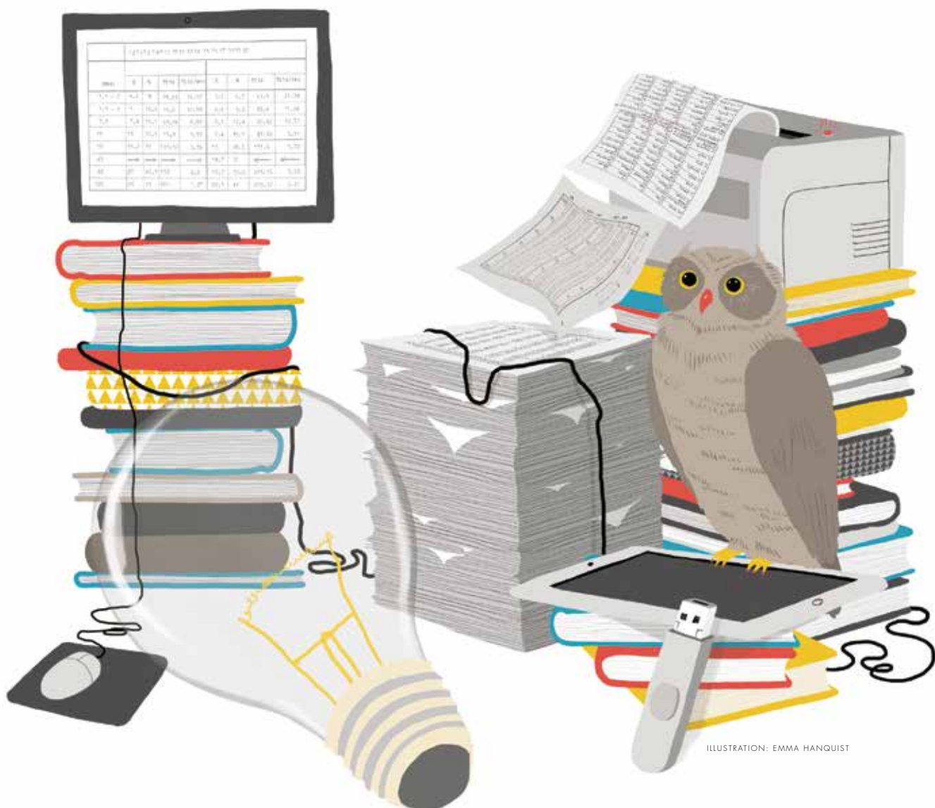
ILLUSTRATION: EMMA HANQUIST

1900-talet. Under de senare decennierna har jämställdhetspolitiken i hög grad varit inriktad på att få in kvinnorna på arbetsmarknaden, och därmed skapa lösningar för familjelivet. Genom detta arbete med att skapa en tvåförsörjarmodell i de nordiska länderna blev det också ökat fokus på männen. Under 1990-talet började det pratas mer om männens roll i jämställdhetsarbetet i alla nordiska länder. I Danmark, Island, Norge och Finland tillsattes särskilda manskommittéer, i Sverige tillsattes tjänster med ansvar för mansfrågorna. Lagarna i familjepolitiken ändrades för att se till barnens rätt att bli omhändertagna av båda sina föräldrar. Ytterligare en del av arbetet var reformer för att öka fädernas andel av föräldraledigheten, vilka varit de största jämställdhetspolitiska åtgärderna som riktats mot män i de nordiska länderna. Från 2000-talet och framåt har området män