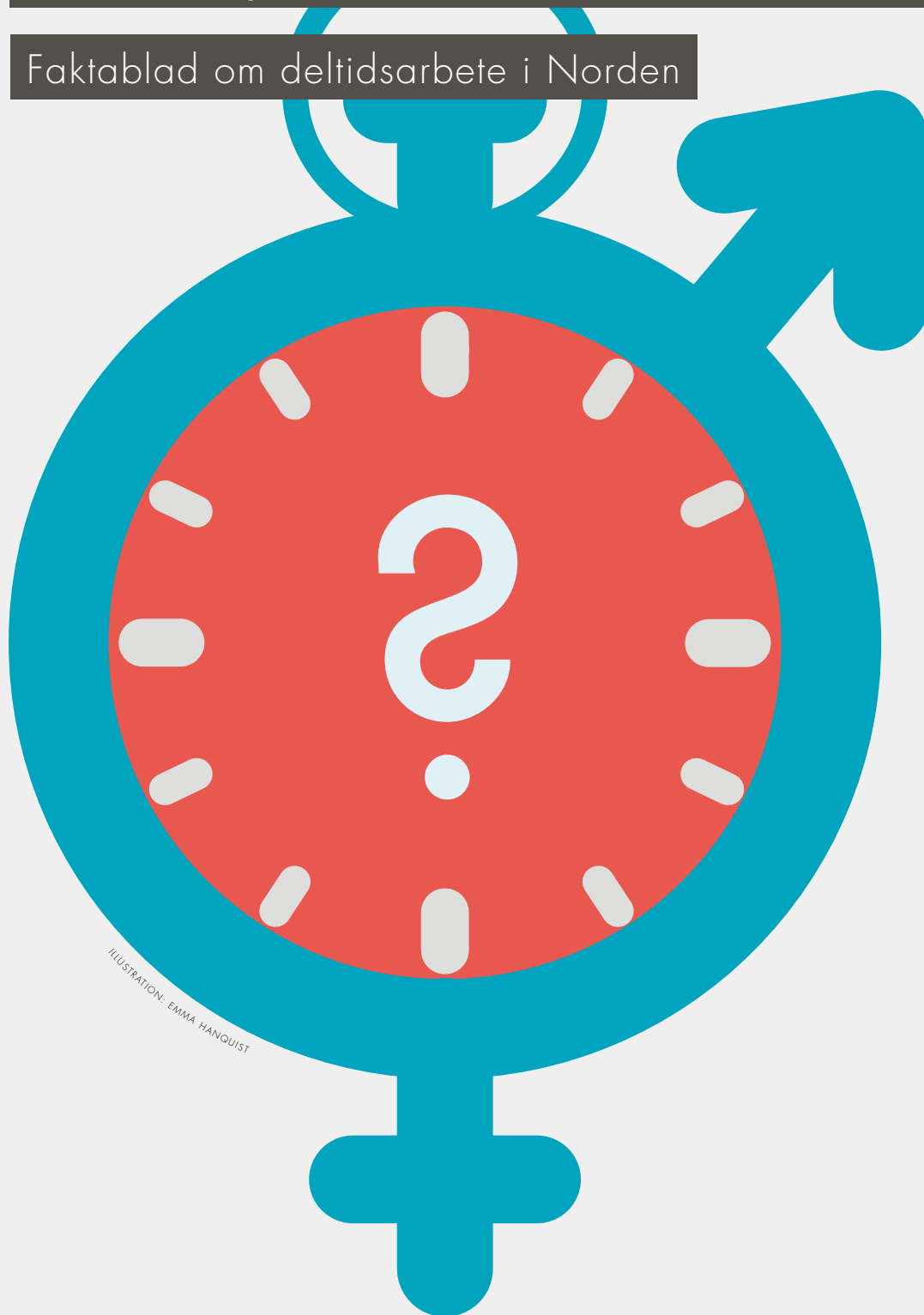
ILLUSTRATION: EMMA HANQUIST